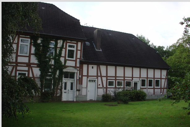
Vorderansicht vom Pfarrhaus im Sommer