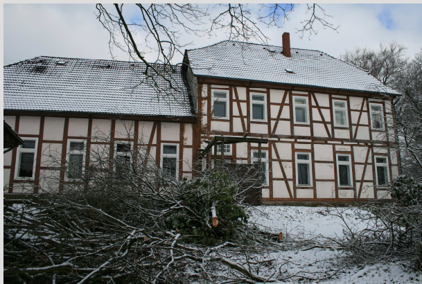
Rückansicht vom Pfarrhaus im Winter

Sie erhalten über Ihren Spendenbetrag eine Spendenbescheinigung.