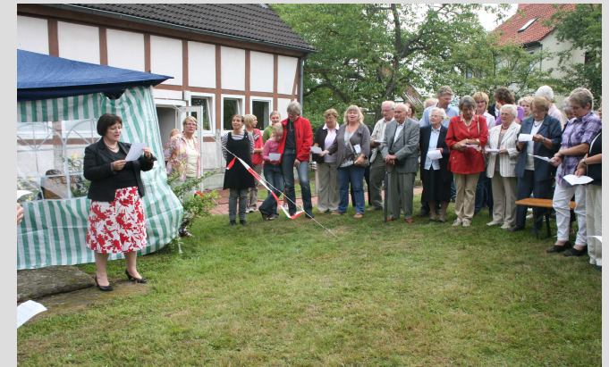
Abschlussrunde beim Gemeindefest im August 2010