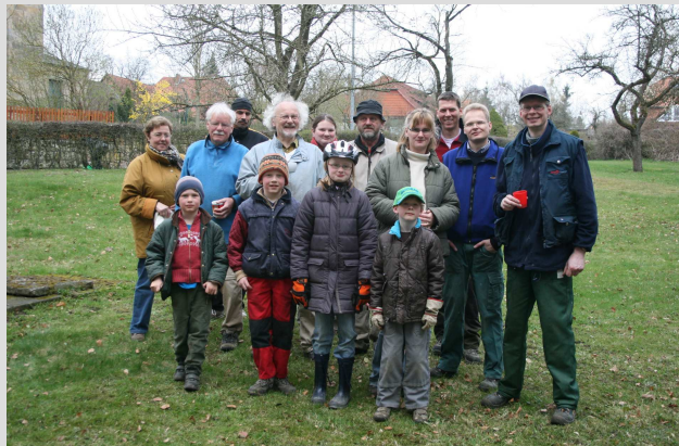
Kleine u. große Helfer beim Frühjahrsputz im April 2010